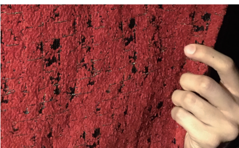
▲ 特注でつくられた西陣織の暖簾。

百聞は一見にしかずというように、どれだけたくさんの資料を見るよりも、カラダを使って江戸の町を体験するほうがより理解できるものです。展示を見た後は、静止画の中にも不思議と動きを感じられるようになり、浮世絵の存在がぐっと近くなりました。浮世絵へのイメージが変わってしまう今回の展示、ぜひ一度！（ヨシヤマ）