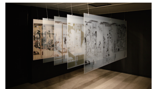
▲ 多色刷りを、色の層で解体しています！