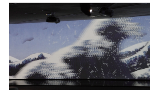
▲ 北斎の海も、はげしく荒れています！