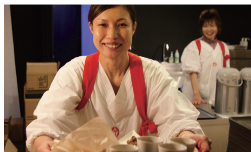
▲ 店員さんのエプロンには食神のシンボルが刺繍。